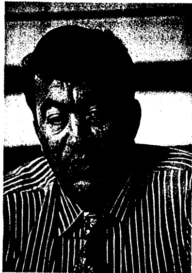
Francisco Álvarez Cascos.