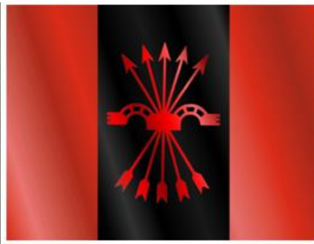
JOSE MARIA AZNAR

Su nombre completo es José María Alfredo Aznar López , pero nunca ha utilizado el nombre de Alfredo. Aunque alguna similitud tienen el tal José María Aznar con el Alfredo Di Stefano, uno se ha dedicado a tocar las pelotas toda su vida y el otro su vida giraba en torno al toque de pelotas.